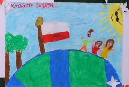
KONKURS PLASTYCZNY "DLA NIEPODLEGŁEJ"